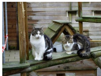
Bertje en Papalou

Ook bij deze Kattebel hebben wij weer een acceptgiro ingesloten. Mocht u ons al gesteund hebben, dan kunt u deze uiteraard als niet ontvangen beschouwen.