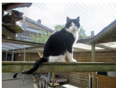
En zo zie ik er nu uit!

O ja, ik wil nog even zeggen dat ik zoals jullie hieronder in "Het Kattebelletje" kunnen lezen,